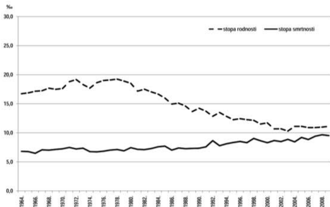
Sl. 1. Kretanje stopa rodnosti i smrtnosti u obalnom pojasu Splitsko-dalmatinske županije od 1964. do 2008. godine

Izvor: Mišetić, R., 2010: Srednja Dalmacija: prostor diferencijalnoga demografskog razvitka (1961.-2001.), Migracijske i etničke teme 26 (3), 297-319.